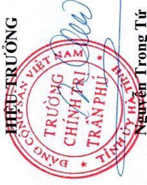
Trần Phú Trưởng Chính trị